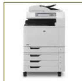
Scan en archiveer met de Papervision® Capture server