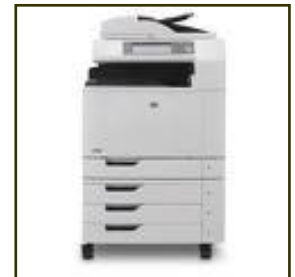
Scan en archiveer met de PaperVision® Capture server